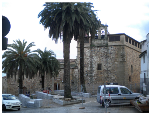
Figure 14 : La Plaza de Santa Clara en cours de réaménagement

De plus, les opérations concernant les espaces publics prennent une place importante dans le projet Intramuros et sont exécutées à court terme puisque les travaux concernant les places ont déjà débutés. Ces interventions concernent directement ces espaces publics mais semblent être aussi envisagées dans leur articulation avec d'autres espaces (par exemple, les mesures du Plan de mobilité auront une influence sur les modes de déplacement à une large échelle) et en s'associant avec des thématiques abordées par les autres axes d'intervention (par exemple, le projet de revitalisation fonctionnelle s'articule prioritairement autour de la Plaza Mayor et de la Plaza de la Concepción).