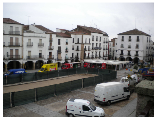
Figure 15 : La Plaza Mayor en cours de réaménagement

Enfin, dans le but de voir dans quelle mesure ces opérations affichées, relatives aux espaces publics, répondent à la volonté d'intégrer, dans ce site patrimonial, des exigences liées au développement durable, nous allons les analyser à travers un outil d'interrogation spécifique.