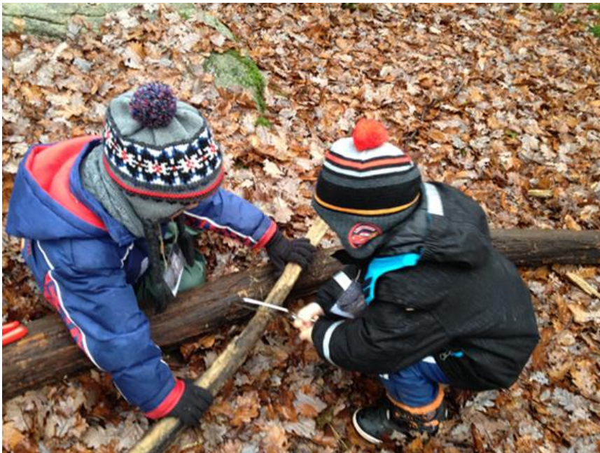
« Je tiens fort et tu scies ».