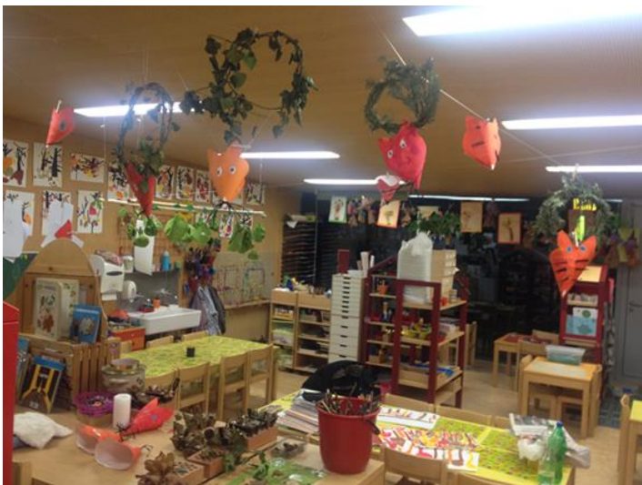
Aperçu de la salle de classe de Katy.