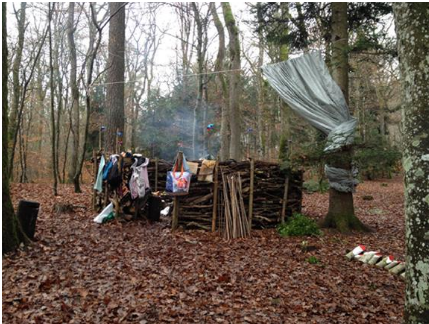
Vue d'ensemble du « Canapé Forestier ».