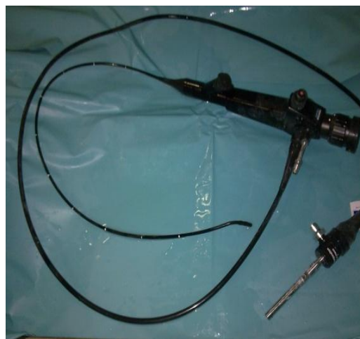
Figure2 : bronchoscope

Les endoscopes possédant des canaux sont des dispositifs médicaux complexes constitués par l'assemblage de plusieurs dizaines de pièces en matériaux divers. Ils présentent des canaux internes en nombre variable, pouvant atteindre plus d'un mètre de longueur et de diamètre interne de l'ordre du millimètre, reliés les uns aux autres par des jonctions créant des anfractuosités et des circuits préférentiels.