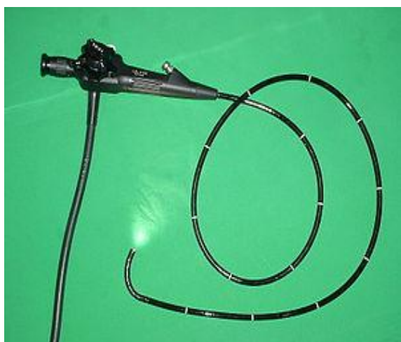
Figure1 : gastroscope