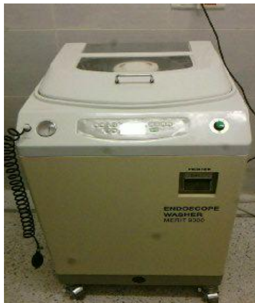
Figure3 : la machine à laver et à désinfecter des endoscopes

De nombreuses études ont montré que le système de lavage automatisé précédé par une étape de prétraitement, de 1 er nettoyage, de 1 er rinçage et de 2 ème nettoyage