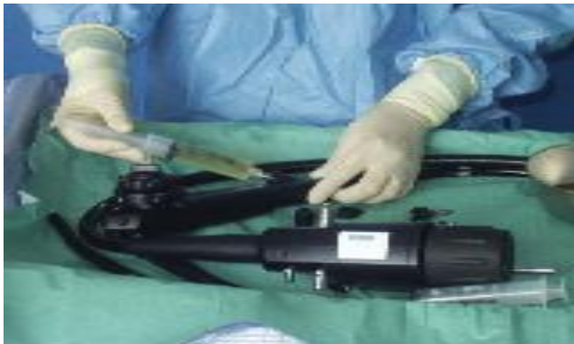
Figure4 : prélèvement à l'aide d'une seringue stérile

Les échantillons ont été prélevés dans des flacons stériles.