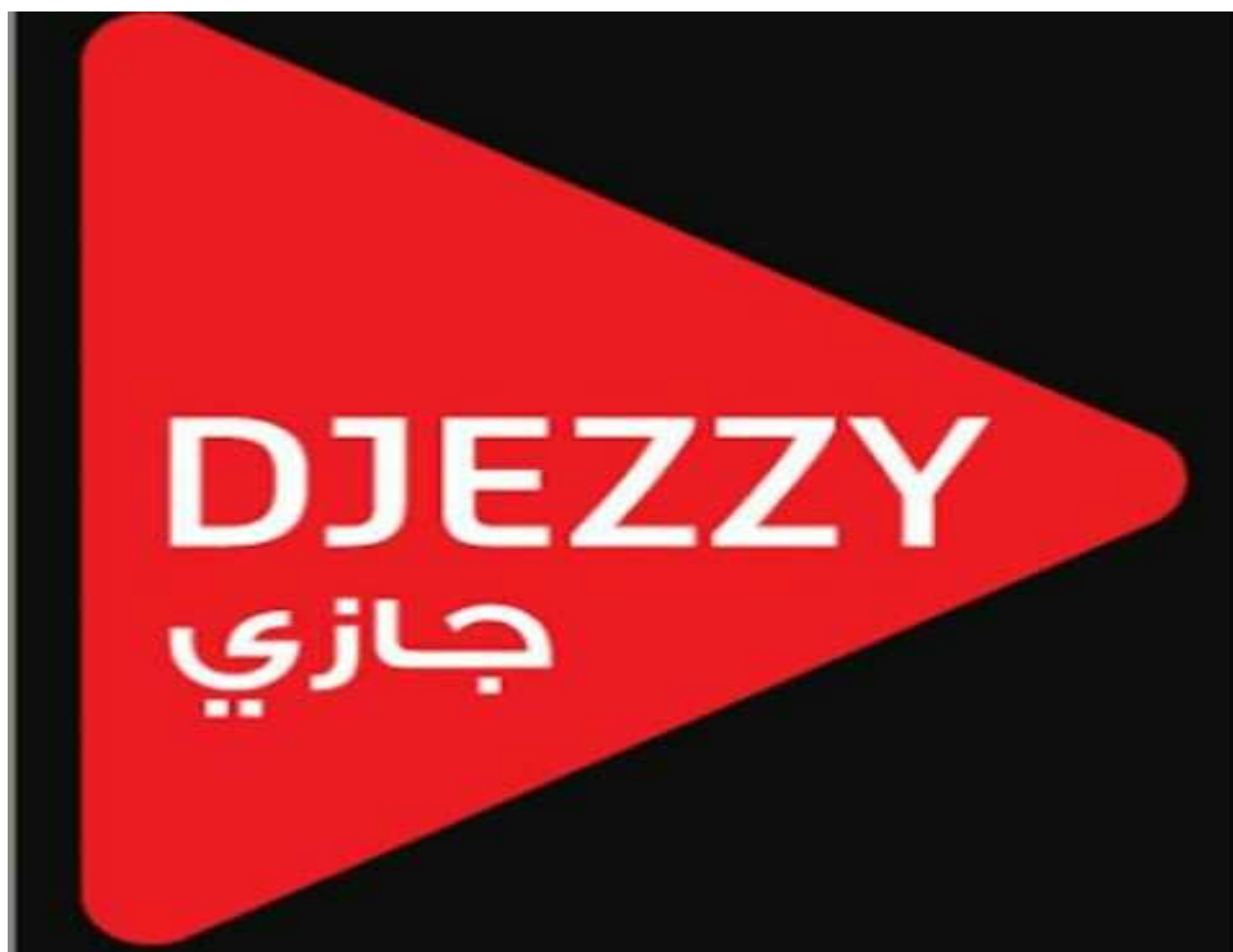
Figure 04 : le logo de DJEZZY