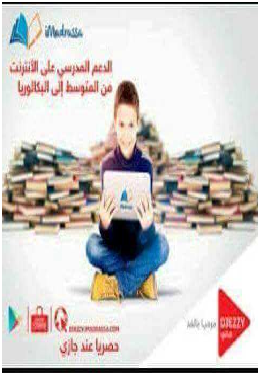
Figure 1 : Djezzy (Imadrassa)