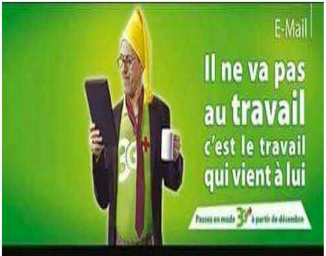
Figure 3 : MOBILIS 3G++