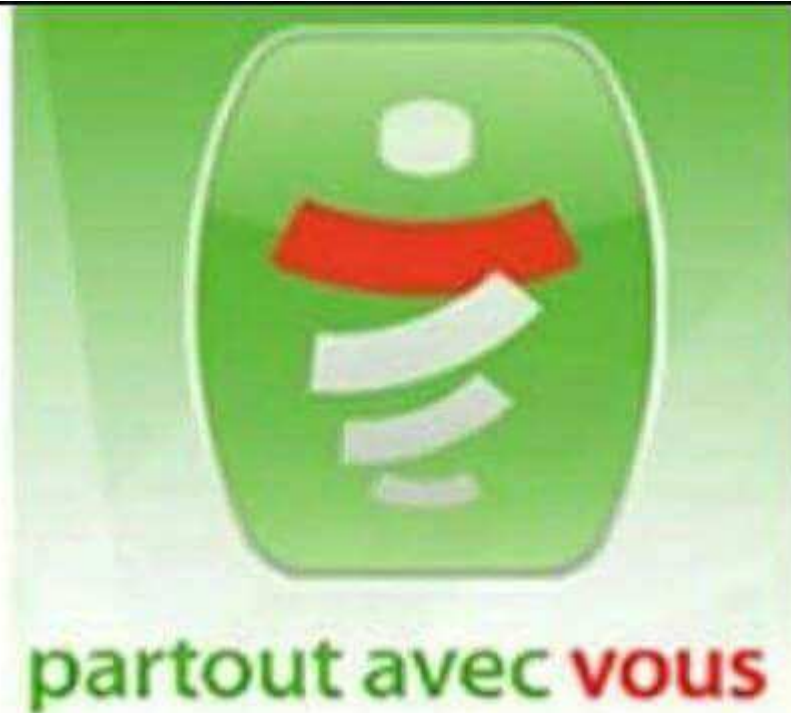
Figure 1 : le logo de Mobilis