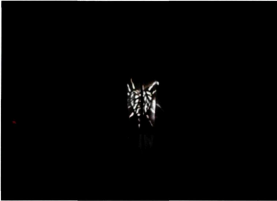
Figure 3.8 : Sacré-Cœur (détail de l'œuvre finale)