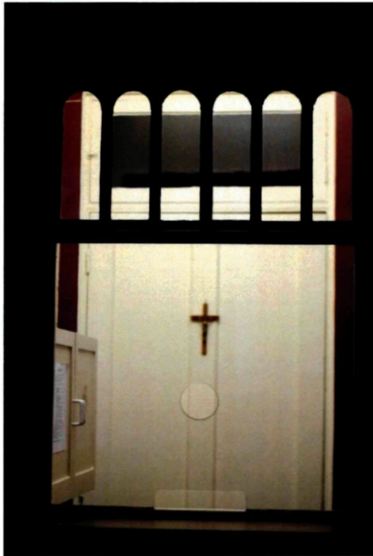
Figure 3.2 : Réception du couvent des Sœurs du Très Saint-Sacrement, Chicoutimi.