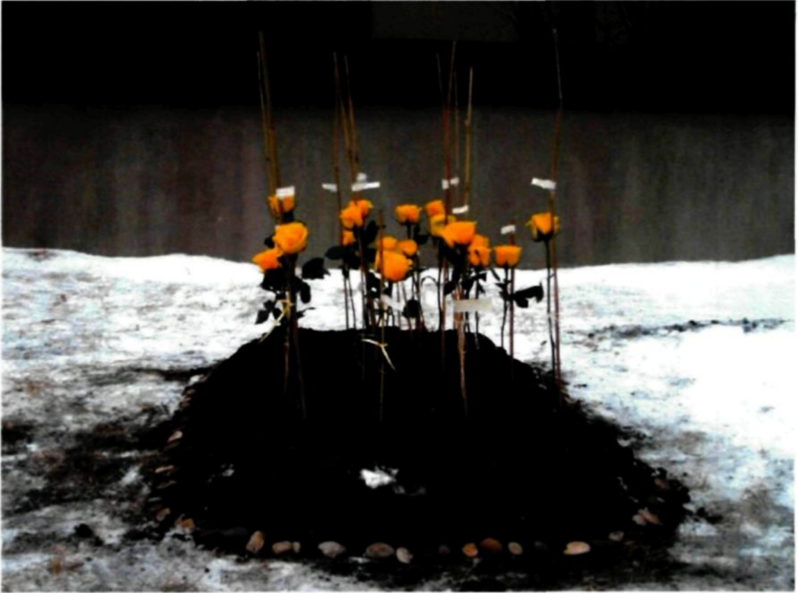
Figure 2.5 : Monument IV , 2012.