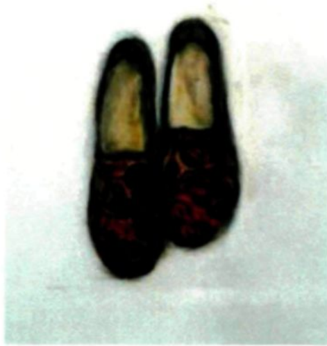
Figure 2.1 : Vestiges, 1998.