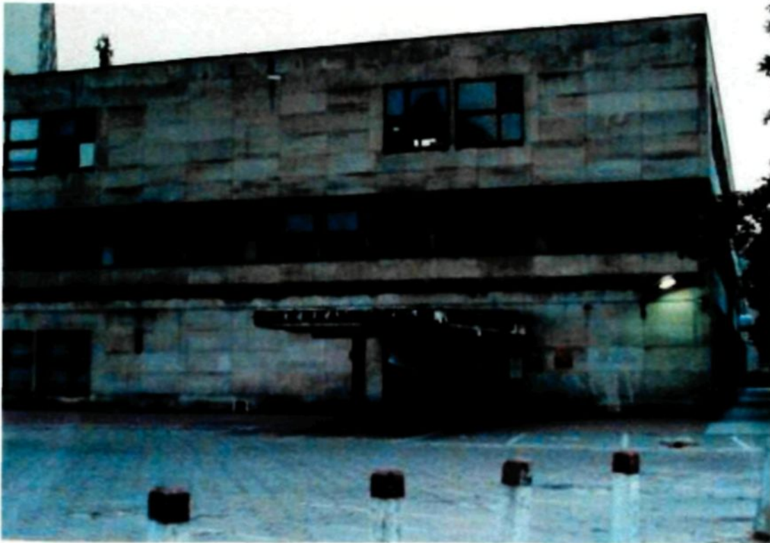
Figure 1.1 : Ancienne synagogue, Varsovie, Pologne, 2003