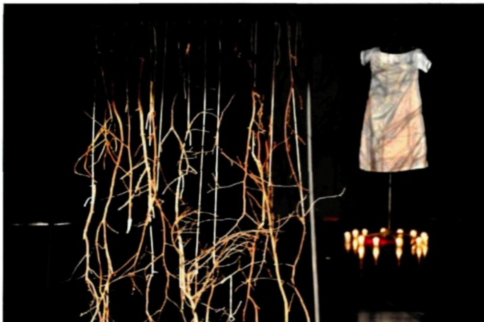
Figure 2.3 : Monument II, 2012.