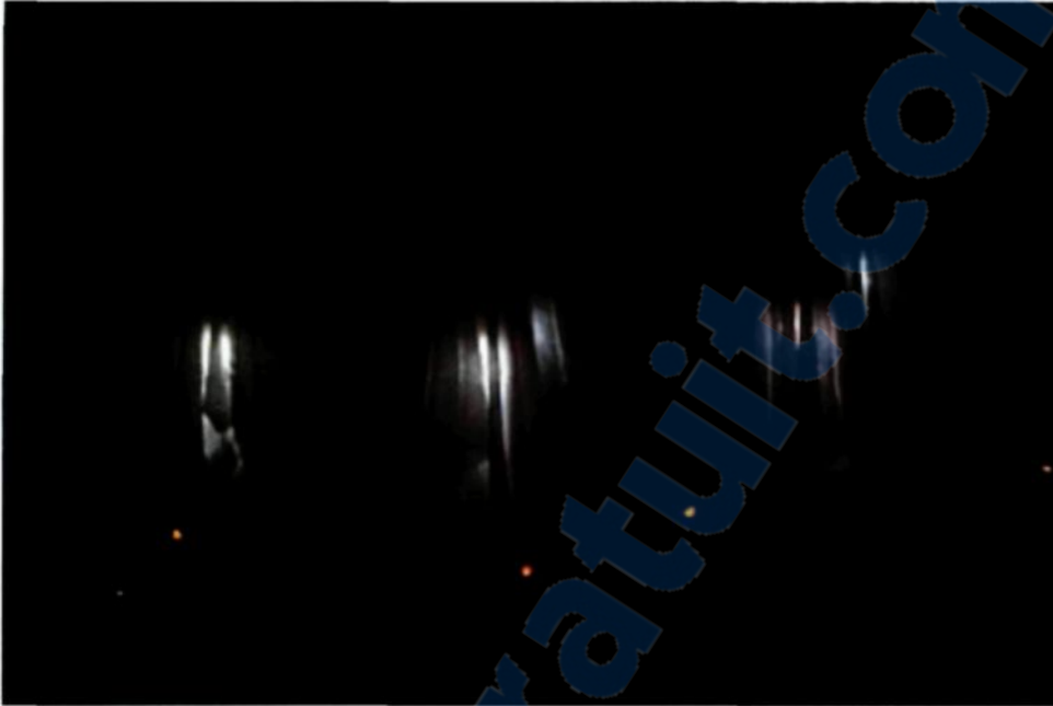
Figure 3.10 : Œuvre finale