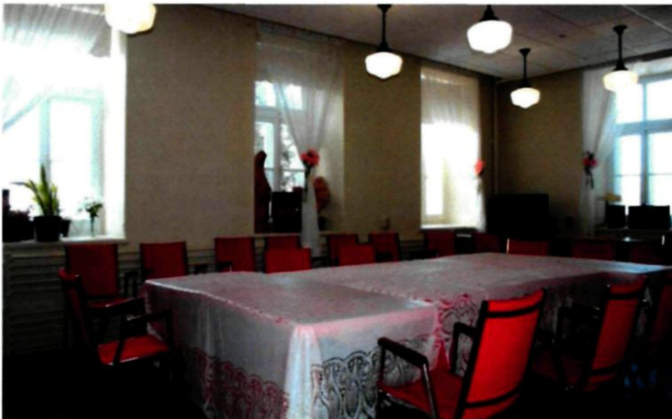
Figure 3.5 : Le réfectoire du couvent des Sœurs du Très Saint-Sacrement, Chicoutimi.