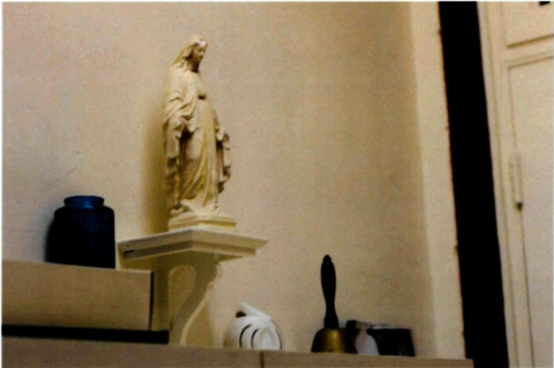
Figure 3.3 : Objet de culte ornant le bureau de la réception, couvent des Sœurs du Très Saint-Sacrement, Chicoutimi.