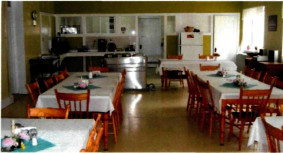
Figure 3.4 : Le réfectoire du couvent des Sœurs du Très Saint-Sacrement, Chicoutimi.