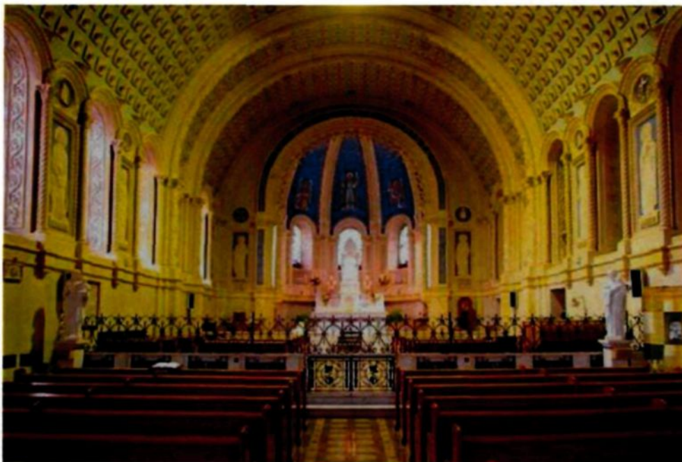
Figure 3.6 : Intérieur de Chapelle des Sœurs du Très Saint-Sacrement, Chicoutimi.