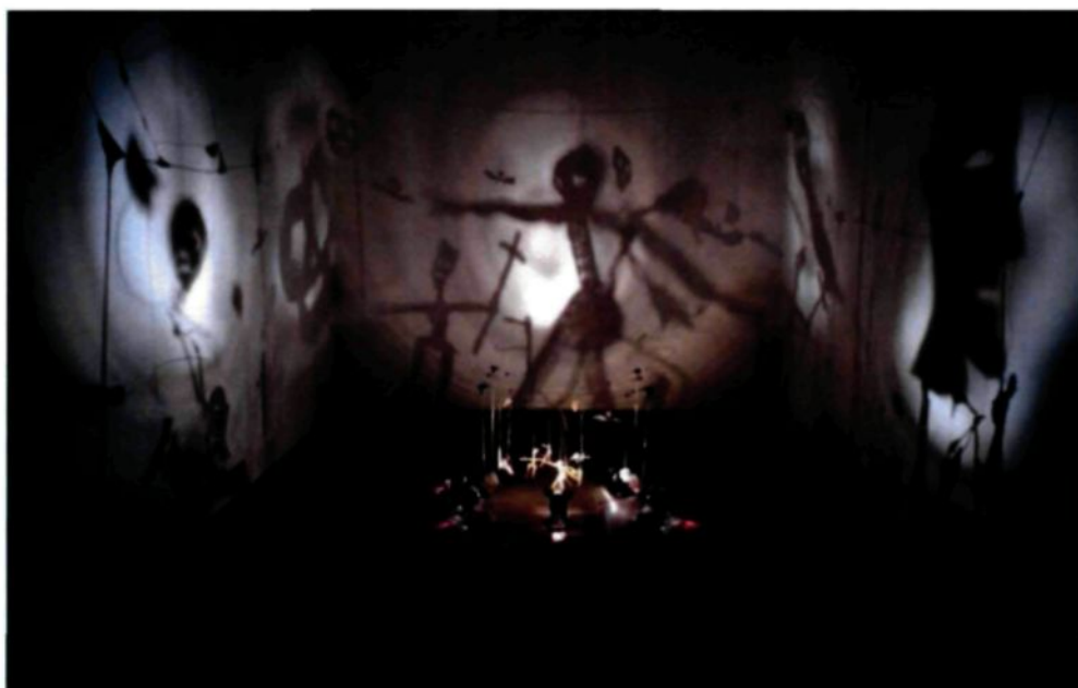
Figure 2.4 : Leçon des ténèbres de Christian Boltanski, 1988.