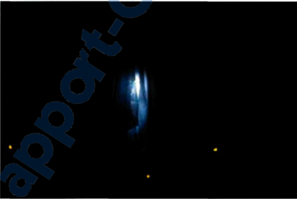
Figure 3.11 : Détail de l'œuvre finale