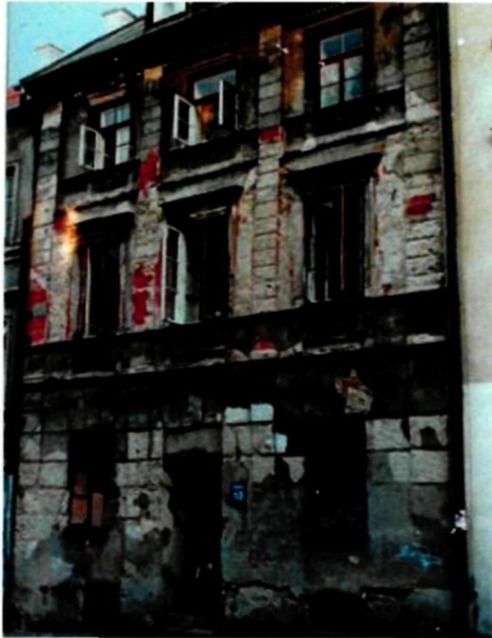
Figure 1.2 : Ancienne demeure ayant appartenu à une famille juive, Lublin, Pologne, 2003