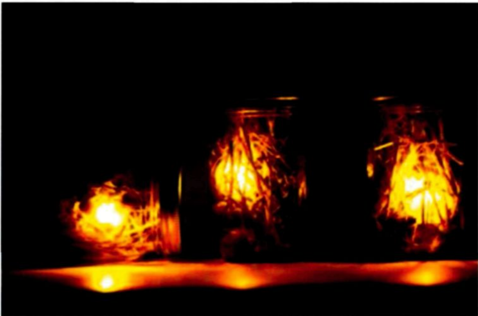
Figure 3.9 : Lanternes (détail de l'œuvre finale)