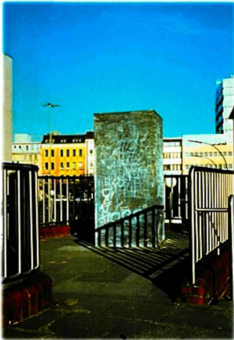
Figure 2.7 : Monument contre le fascisme de Yochen Gerz, 1986.