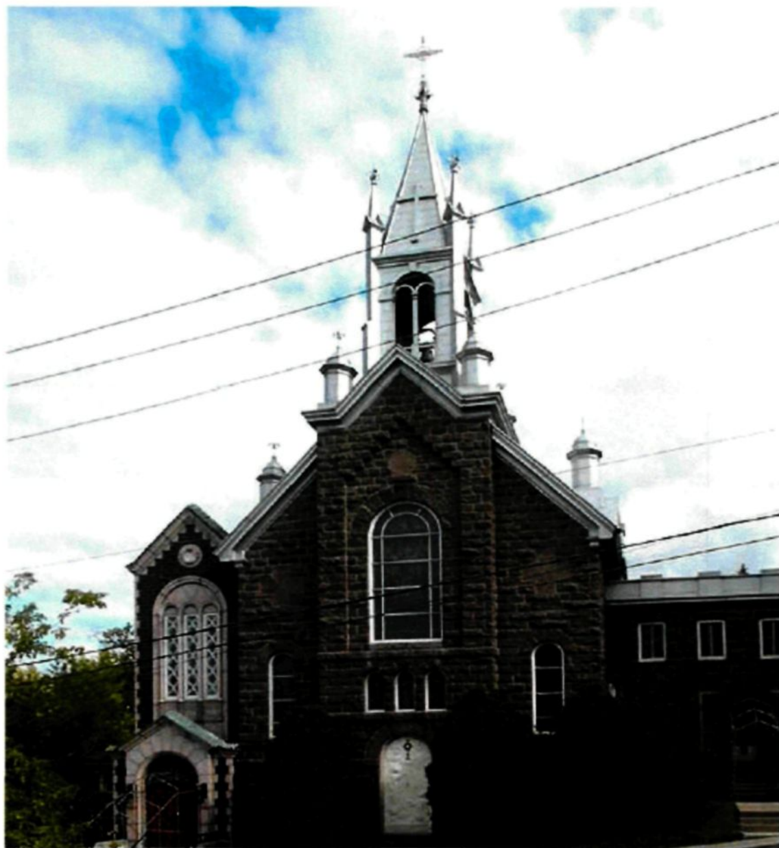
Figure 3.1 : Chapelle du couvent des Sœurs du Très Saint-Sacrement, Chicoutimi.