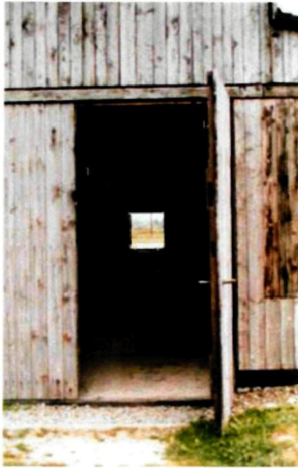
Figure 1.3 : Camp de travail Majdanek, Lublin, Pologne, 2003