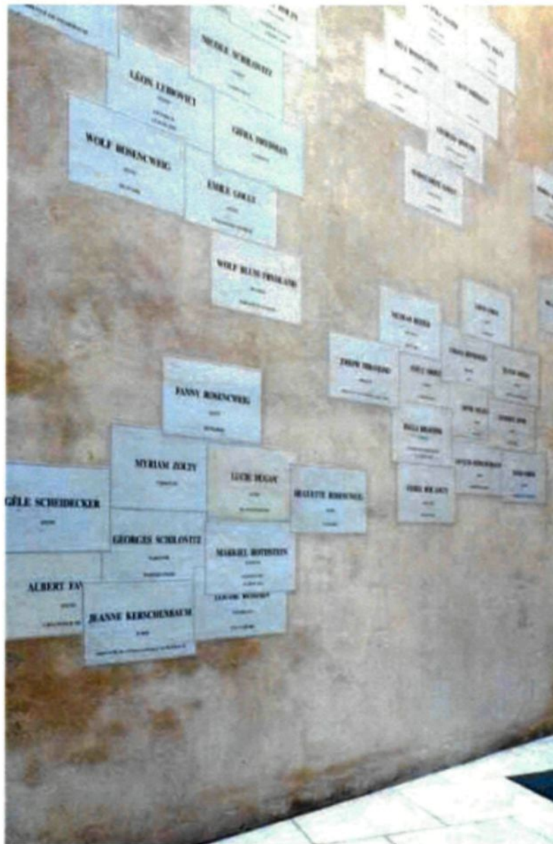
Figure 2.6 : Monument à la mémoire des habitants de l'hôtel de Saint-Aignan, de Christian Boltanski, 1998.