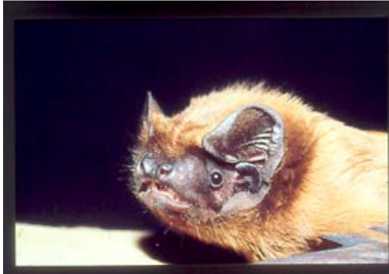
Photo 8. La grande noctule.