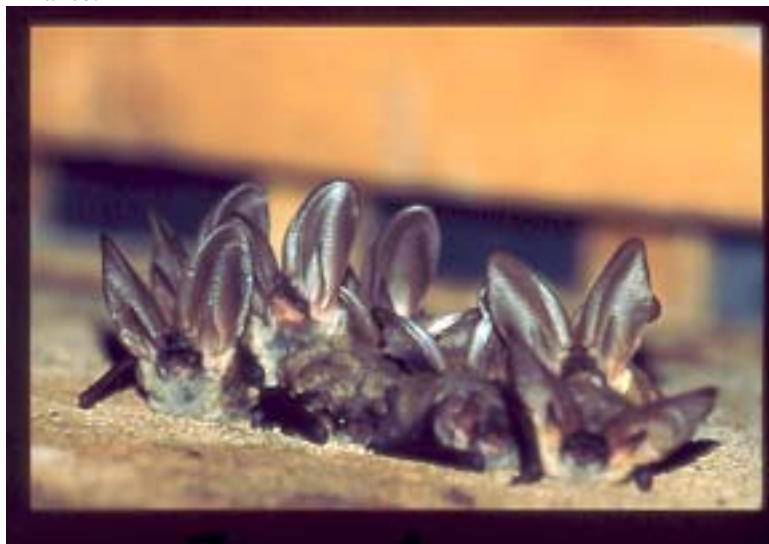
Photo 10. Oreillards gris.