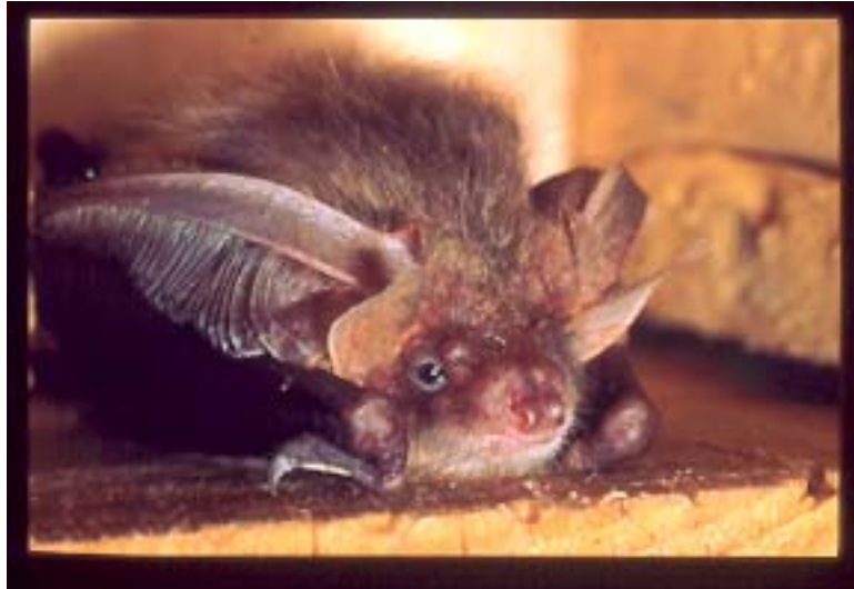
Photo 9. Oreillard roux.

-L'oreillard gris ( Plecotus austriacus ).