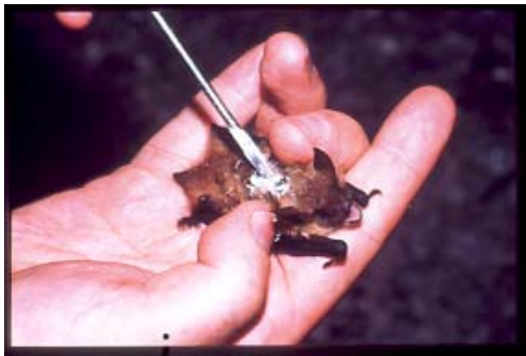
Photo 6. Pose d'un émetteur sur un Myotis emarginatus .

Son dos est roux foncé et il est un peu plus petit que le vespertilion à grands pieds. Il est toujours rare même si les comptages montrent que ses effectifs ont doublé depuis 10 ans. On peut le trouver partout en France sauf dans le Sud Ouest. Il est très abondant dans la vallée de la Loire jusqu'en Charente.