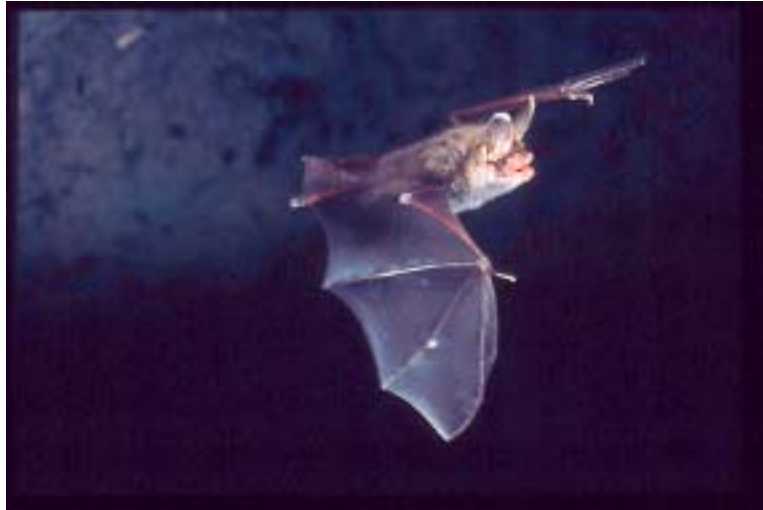
Photo 5. Le vespertilion de Bechstein.