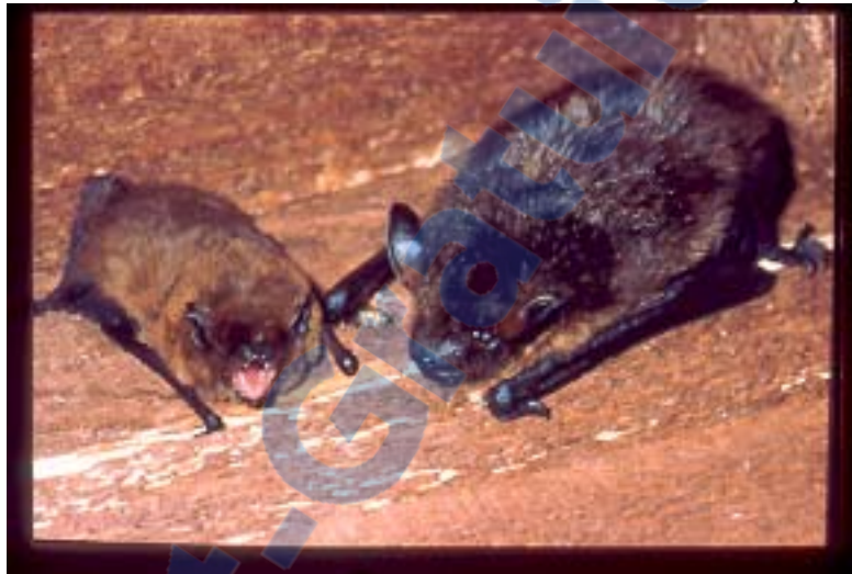
Photo 7. Pipistrelle commune à gauche, sérotine commune à droite.

Le plus petit Chiroptère d'Europe s'est très bien adapté à l'homme. Il peut se glisser à travers des interstices d'un centimètre ce qui lui permet de conquérir tous les bâtiments. En Europe, c'est la plus fréquente des chauves-souris. Elle est très commune en France et notamment à Paris. Elle vit en effet souvent près des agglomérations.