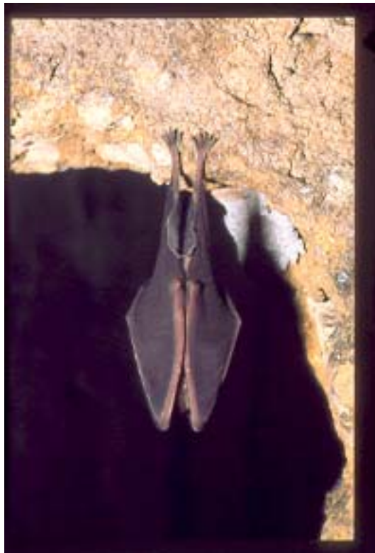
Photo 3. Un grand rhinolophe enveloppé dans son patagium.

Les rhinolophes sont toujours attachés à distance les uns des autres. En Corse, on les surnomme les « sacchi panni », les petits sacs suspendus car ils s'enveloppent dans leur patagium lors du repos. Ils aiment la chaleur. Ils résident donc plutôt en régions méditerranéennes. Ils hibernent dans les grottes où il ne faut pas les déranger car ils sont très sensibles au bruit.