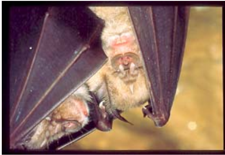
Photo 4. Le grand rhinolophe.