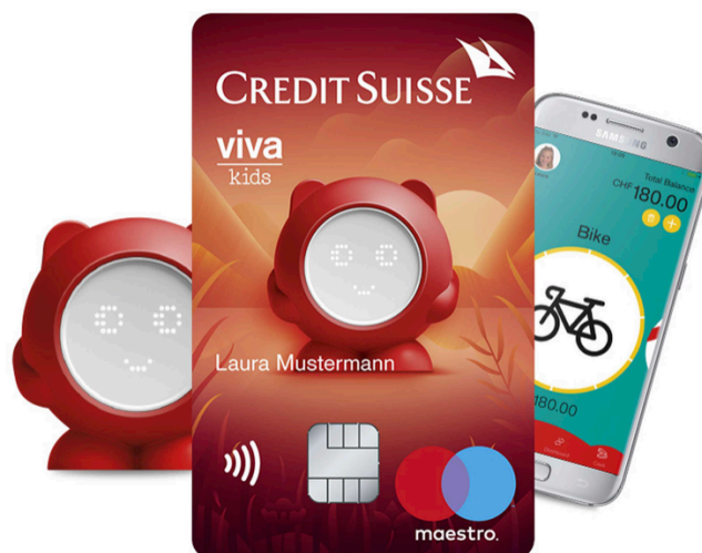
Figure 4 : L'offre pour enfants du Credit Suisse

Je trouve cette solution remarquable car d'un point de vue stratégique, le Credit Suisse se place comme un accompagnateur dans la vie financière du client, dès son plus jeune âge et sa tirelire restera ancrée dans la mémoire de l'enfant une fois arrivée adulte. Cette stratégie me réconforte dans ma recommandation afin de mieux fidéliser la clientèle et elle est un bon exemple de fidélisation à travers la digitalisation.