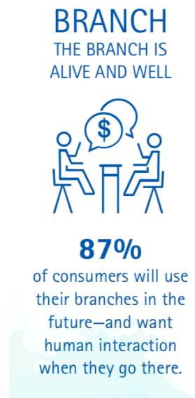
Figure 2 : Sondage Accenture 2016