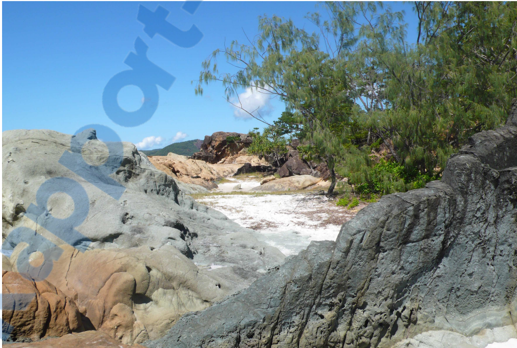
Withsunday Island, Australie

Ce travail étant réalisé à deux, nous avons dès le début mis un accent particulier sur la communication au sein du binôme. Les conflits de valeurs, les points de vue divergents, des situations personnelles compliquées ont représenté autant de facteurs susceptibles de mettre à rude épreuve notre collaboration et notre complémentarité. Nous avons su adopter une posture professionnelle et se dire les choses franchement, de façon constructive, dans l'intérêt de notre recherche.