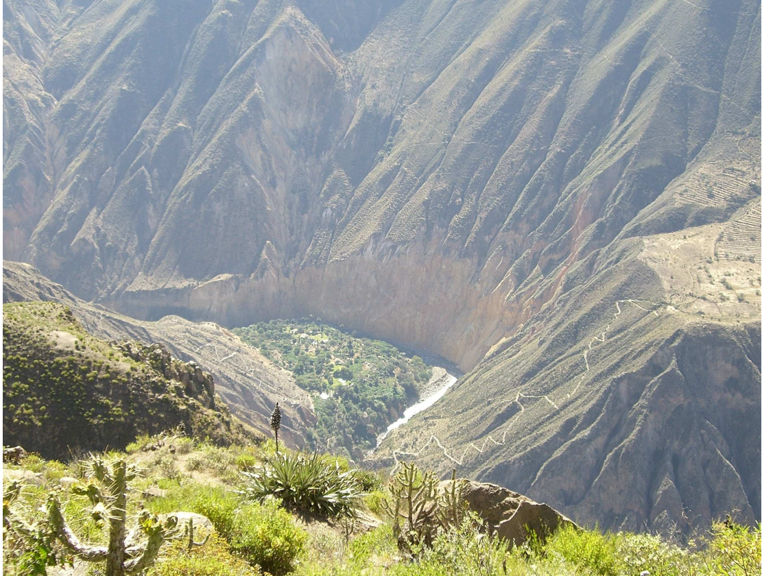
Cañon del Colca, région d'Arequipa, Pérou