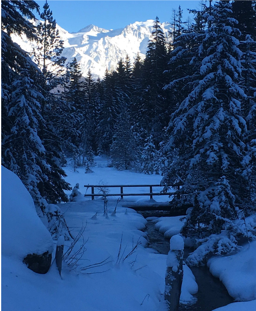
Région de Champex-Lac, Valais, Suisse