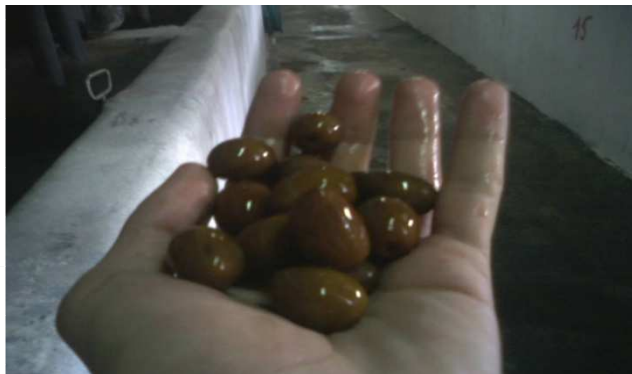
Figure : Les OTC après le traitement

L'aération ou barbotage se fait par une canalisation perforée transversale au fond de chaque cuve qui dégage de l'air par un système de pompage de l'air de l'extérieur.