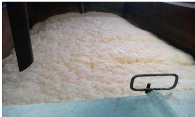
Figure : Le traitement alcalin