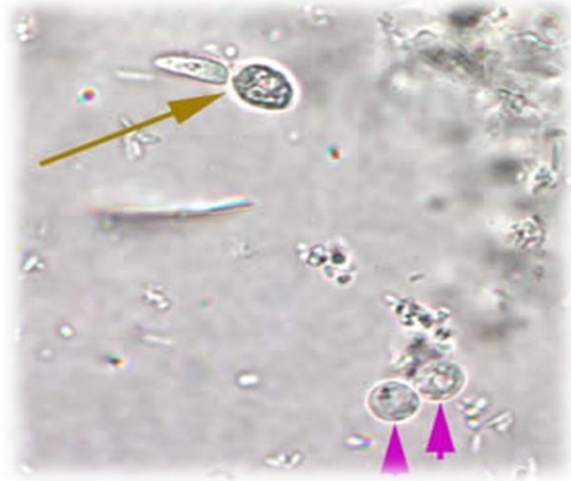
Figure 1: Cryptosporidium Sp.