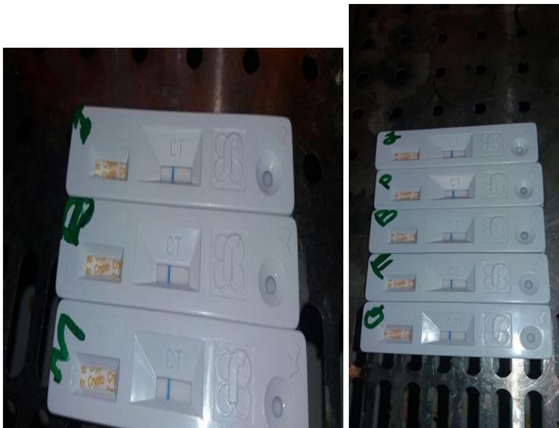
Figure 3 : teste rapide du Cryptosporidium