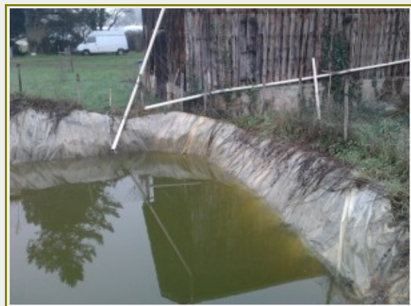
Récupération des eaux de pluies et stockage dans réserve