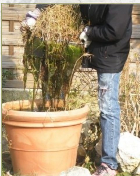
Les plantes captent les nitrates via leurs racines et dépolluent ainsi l'eau

Donc concrètement au jardin : nul besoin de pompe, filtre, UV ou produit chimique dans votre bassin si vous le plantez suffisamment. C'est la technique que j'ai appliquée avec succès dans mon bassin pour balcon et dans mon aquarium . Ce sont les nombreuses plantes, via leurs racines, qui vont naturellement « dépolluer » l'eau de ses nitrates. Il faut bien entendu être « raisonnable » et limiter alors les producteurs principaux de déchets : les poissons.