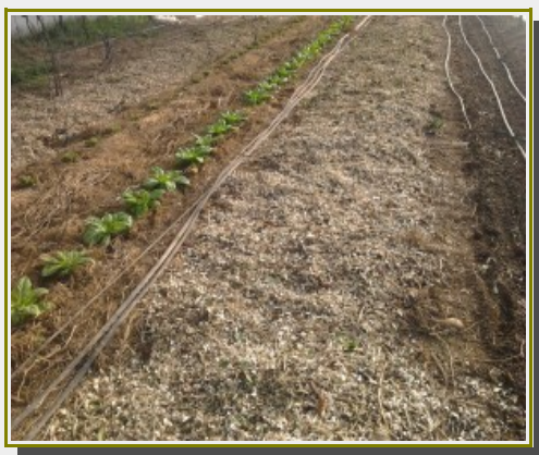
Salades paillées et BRF

De plus en plus de jardiniers couvrent aujourd'hui le sol de leur jardin, que ce soit avec un paillage classique, avec un mulch de déchets végétaux ou encore avec un BRF (Bois Raméal Fragmenté). Chacun peut alors facilement constater que le sol reste ainsi plus frais et humide. Les besoins en arrosage sont alors considérablement diminués.