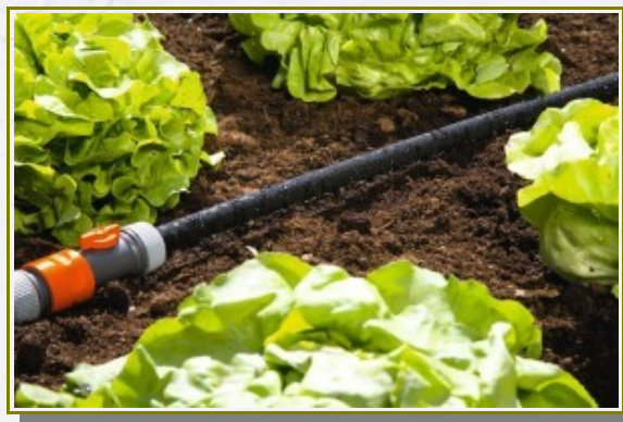
Tuyau micro-poreux

14) Le tuyau micro-poreux est idéal pour les cultures serrées et en ligne (laitues, haricots, lignes de mesclun, oignons, etc...). Le tuyau est souple, vous pouvez le faire passer entre vos plants de tomates, les plantes compagnes associées en profiteront. Il diffuse de l'eau doucement et uniformément sur toute sa longueur. Ce type de tuyau fonctionne à basse pression il faut donc parfois le coupler avec un régulateur de pression