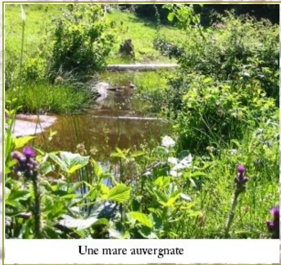
Une mare auvergnate

Quand on a un intérêt particulier pour la nature, on ne peut pas ignorer l'eau, qui a toujours été et